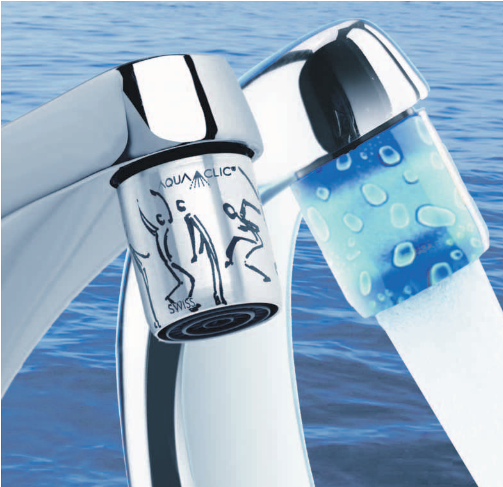
AquaClics, die auf jeden Wasserhahn geschraubt werden können, lassen weniger Wasser durchfliessen.

Jeder Haushalt kann einfach und ohne teure Investitionen Energie und Geld sparen: zum Beispiel mit Wasser sparenden Produkten für Dusche und Wasserhahn. Die Wirkung ist beachtlich. Davon kann sich das interessierte Publikum am Samstag, 24. April an einem Stand auf dem Bläuackerplatz in Köniz überzeugen.