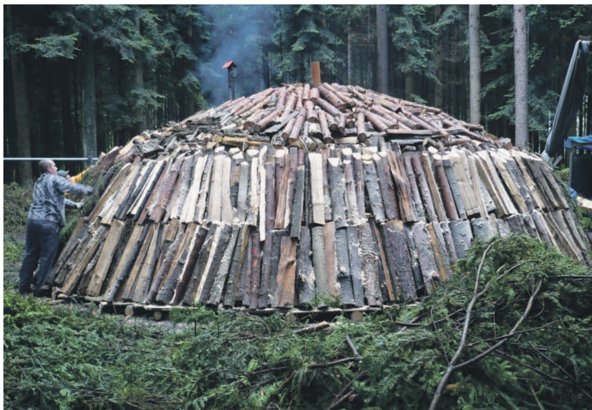
Glühender Kohlenmeiler: Sinnvoll und interessant, doch der Weg zur Bewilligung ist mit zahlreichen Hindernissen belegt.

Der Vorsteher der Direktion Bildung und Soziales äussert sich zur schwierigen Standortsuche für ein interessantes und sinnvolles Projekt.