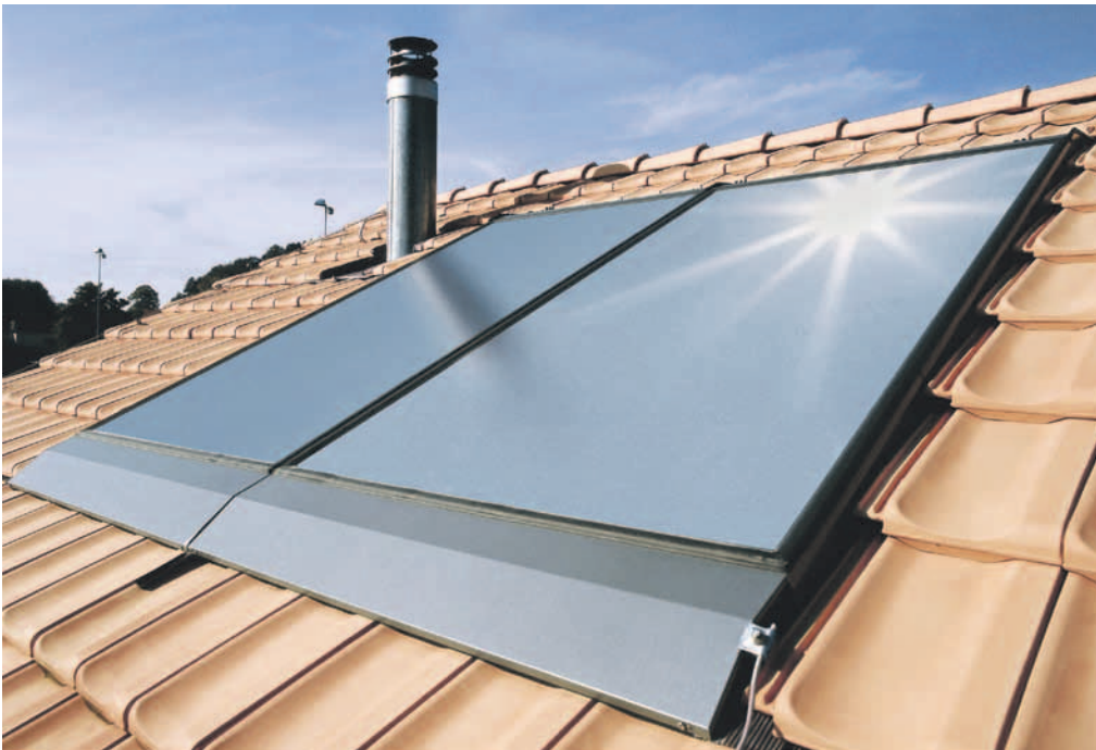
Tag der Sonne am 8. Mai 2010: Die Energiestadt Köniz informiert auf dem Bläuackerplatz.

Radiowecker, Kaffeemaschine, Leselampe, Computer und Herdplatte: Von frühmorgens bis spätabends verbrauchen wir Strom. Dass die Geräte ohne Unterbruch funktionieren, ist hierzulande eine Selbstverständlichkeit. Doch Strom ist nicht gleich Strom. Denn Strom kann nachhaltig und sauber produziert werden. Wer Wert auf eine möglichst umweltschonende Stromproduktion legt, kann einen wichtigen Beitrag dazu leisten: Mit dem Bezug von Ökostrom.