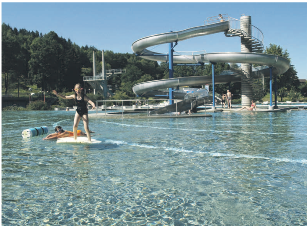
Gesunder Freizeitpass: Das Schwimmbad Köniz lädt ab dem 8. Mai wieder zum Bade.

Am kommenden 8. Mai ist es wieder soweit: Das Schwimmbad Köniz in der Weiermatt öffnet die Tore. Der Vorverkauf der Saisonabonnemente, Kabinen und Kästchen beginnt am 5. Mai.