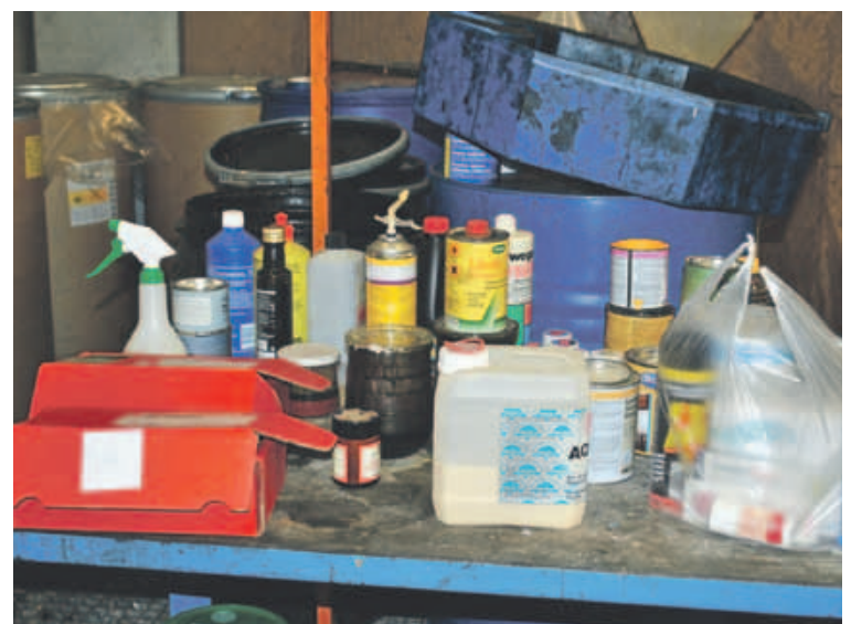
Die Entsorgung ist bei den Recyclingsammelstellen ganz und beim Werkhof grösstenteils kostenlos.