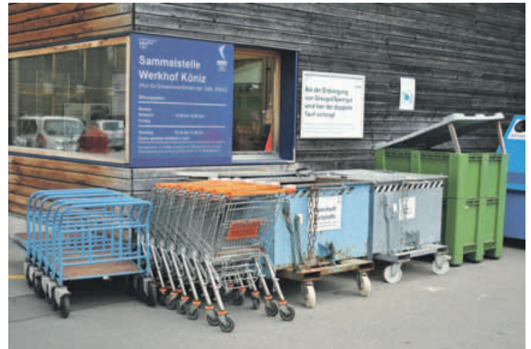
Was wird wo entsorgt? Die Gemeindeangestellten helfen bei der Sammelstelle Werkhof weiter.