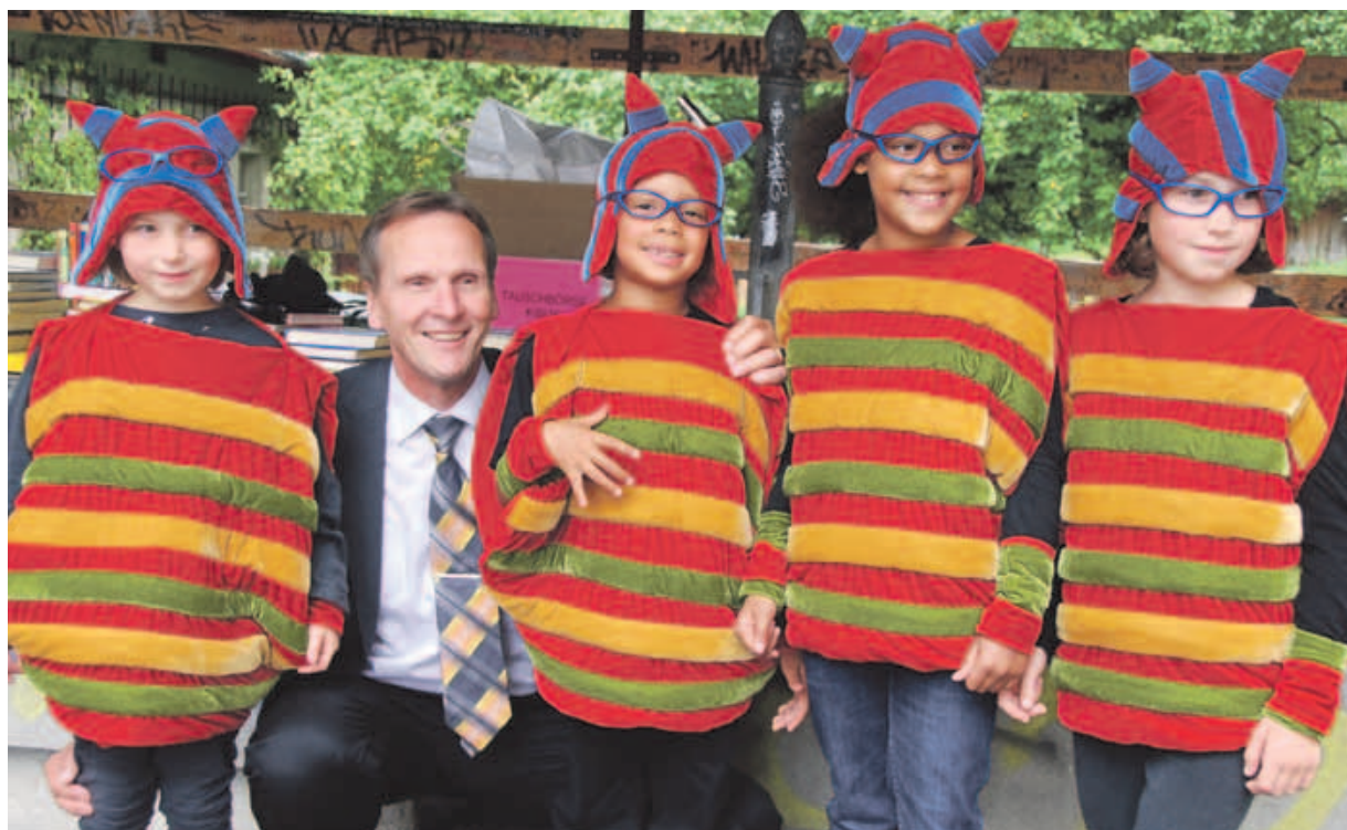
Zum Beispiel das KiBuK: Für die Durchführung des Kinder- und Jugendmedienfestivals Köniz im kommenden September wird es wieder zahlreiche freiwillige Helferinnen und Helfer brauchen.

Der Vorsteher der Direktion Bildung und Soziales über die unverzichtbare Freiwilligenarbeit auch in der Gemeinde Köniz.