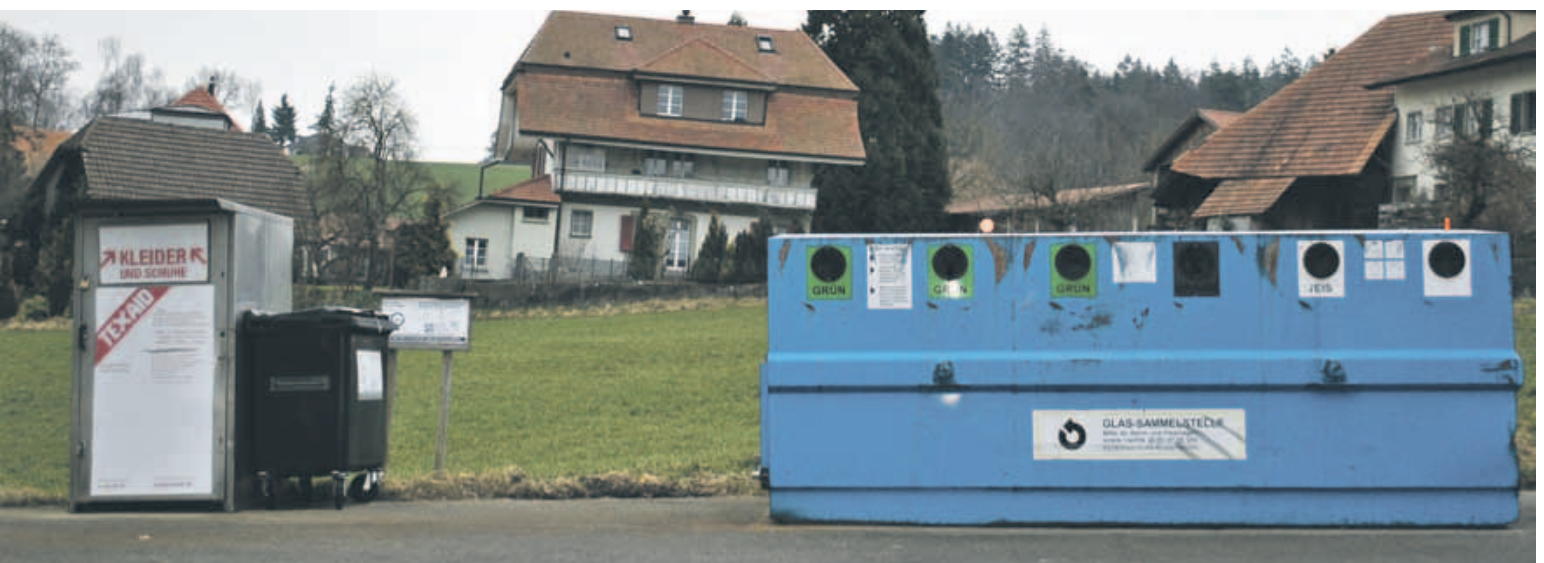
Recyclingsammelstelle in Gasel.

Die Sammelbehälter werden durch die Gemeinde und durch Entsor-