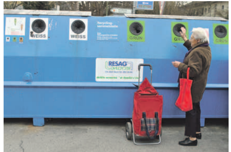
Sowohl auf dem Land als auch in der Stadt: An insgesamt 19 Standorten stehen Recyclingsammelstellen bereit.