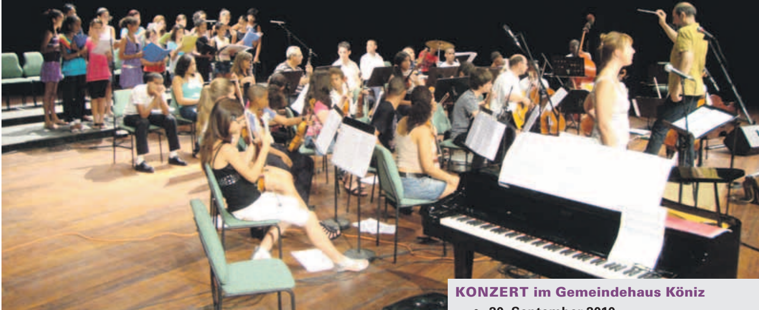
Das Sextett Travesías probt mit dem Orchester der Escuela Paulita Concepción in Havanna (Kuba).

Das international besetzte Sextett Travesías, ein Orchester und Chor mit Schülerinnen und Schülern aus Havanna sowie Kinder der Könizer Schule Buchsee treten am 20. September 2010 an einem gemeinsamen Konzert im Gemeindehaus Köniz auf. Es ist dies der Abschluss eines ungewöhnlichen musikalischen und völkerverbindenden Projekts.