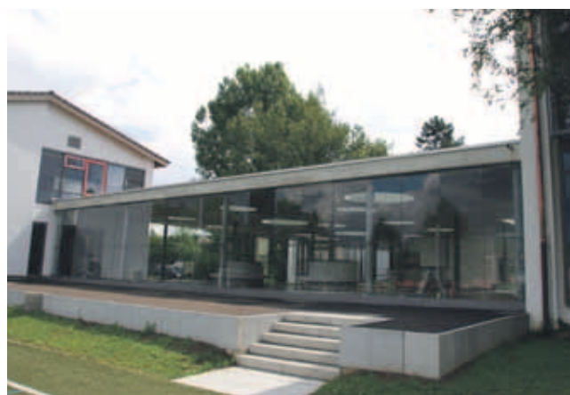
Verglaste Pausenhalle als Zentrum.