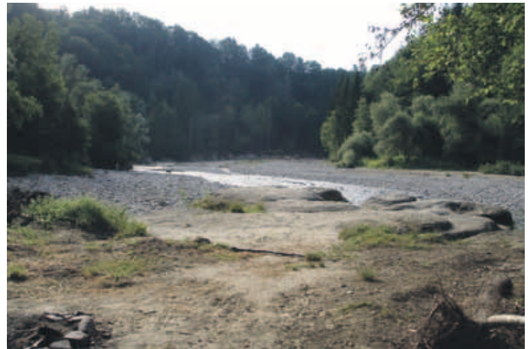
Picknickplatz Heitibüffel: Schöner Picknickplatz direkt an der Sense. Wanderzeit ab Bahnhof Thörishaus Dorf 20 Minuten.

Finden Sie den idealen Könizer Picknickplatz: www.koeniz.ch/picnic