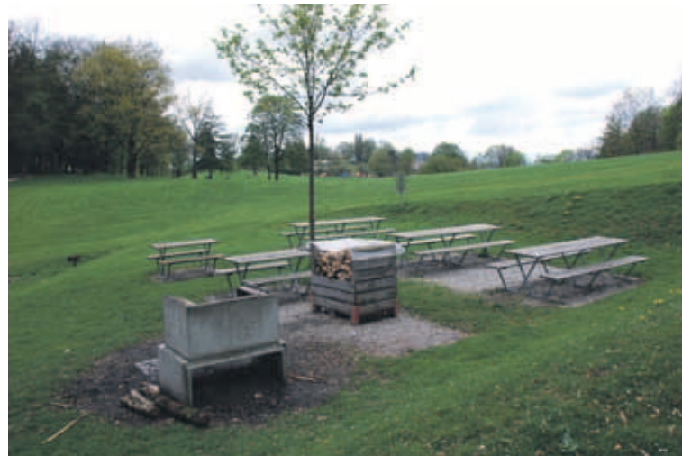
Picknickplatz Gurten: Erreichbar via Endstation Gurtenbahn (ca. 15 Minuten) oder zu Fuss ab Wabern (ca 1 Stunde). Prachtige Aussicht auf die Stadt und Region Bern.

Aber wo genau befinden sich die schönsten Plätze in Köniz?