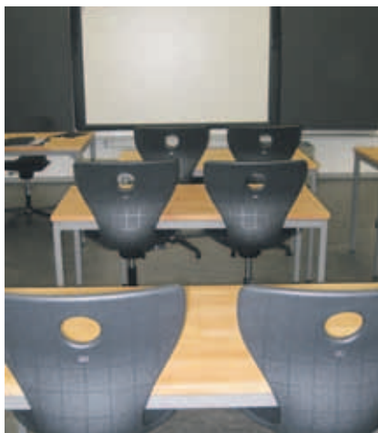
Die Schulzimmer sind bereit.