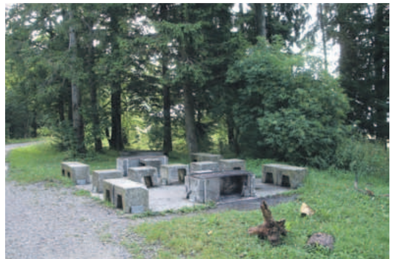
Picknickplatz Ulmizberg: Schöner Aussichtspunkt mit Feuerstelle. 10 Gehminuten ab Parkplatz Ulmiz. Wanderung ab Köniz, Schliern und Oberulmiz möglich.