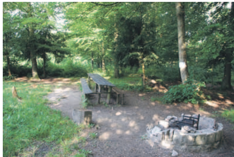
Picknickplatz Schöneegg: Erreichbar in 20 Gehminuten ab Bahnhof Thörishaus. Feuerstelle der Schweizer Familie. Bietet Aussicht auf Berner und Freiburger Alpen.

koeniz.ch arbeitet mit der Picknick-Suchmaschine gopicnic zusammen. Diese gibt einen Überblick über Lage und Ausstattung von gegen 20 Könizer Picknickplätzen, welche mindestens mit einer Feuerstelle und Sitzplätzen ausgestattet sind.