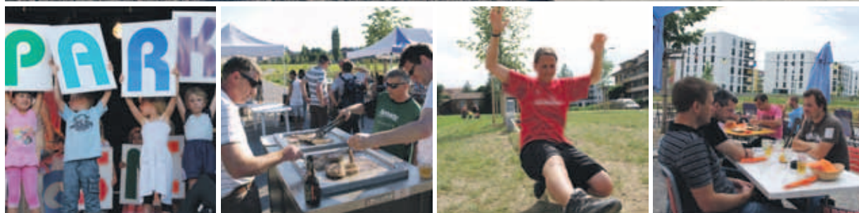
Freizeit, Spass und Erholung an unverbauter Lage: Liebefeld Park.