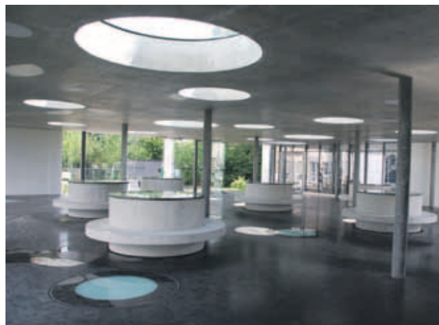
Pausenhalle von Innen.