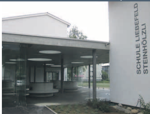
7 Millionen Franken investierte die Gemeinde Köniz in die Sanierung der Schule Liebefeld Steinhölzli.

Anschliessend stehen der interessierten Bevölkerung die Schulhaustüren offen.