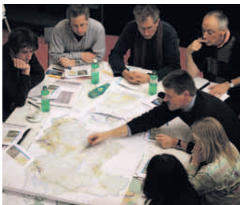
Köniz überarbeitet die Ortsplanung. Die Bevölkerung kann mitreden. Das Mitwirkungsverfahren läuft.

Eine erfolgreiche Raumentwicklung kann nur realisiert werden, wenn diese von der Bevölkerung auch getragen wird. Die Praxis zeigt, dass Transparenz und Einbezug der Bevölkerung die Qualität der Entscheidungen verbessern und diese auch breiter akzeptiert werden. Das erleichtert die Beteiligung und erhöht die Erfolgswahrscheinlichkeit der Planungen und Projekte.