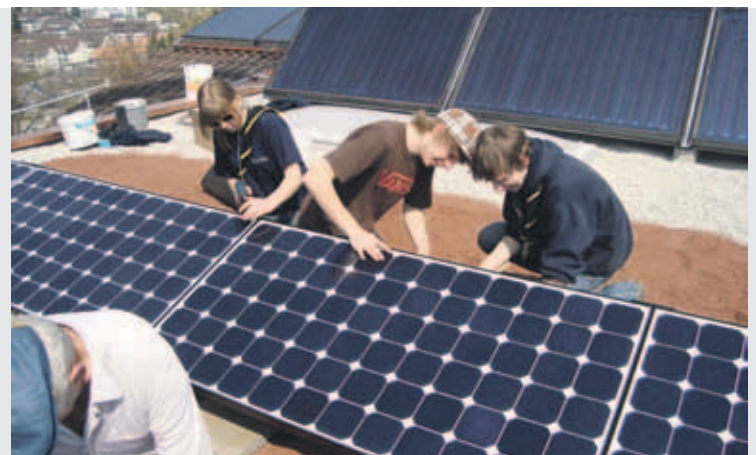
Die erneuerbare Energie wird in Köniz gefördert.