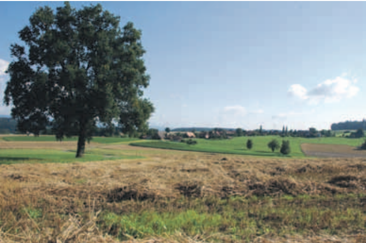
Ländliches Köniz: Die traditionelle landwirtschaftliche Nutzung ist auch in Zukunft wichtig.

netzungsfunktion der Gemeinde. Für die nachhaltige Entwicklung von Köniz sind – neben der Förderung der Lebensqualität an den zentralen Standorten – eine intakte Landschaft und ein funktionierender ländlicher Raum von grosser Bedeutung.