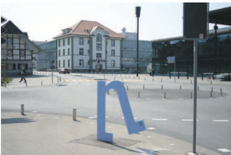
Zentrum Köniz: Der öffentliche Raum soll attraktiv und vernetzt gestaltet werden.