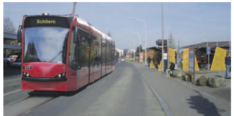
Mobilität in Köniz: Das öffentliche Verkehrsnetz soll mit dem Tram ausgebaut werden.