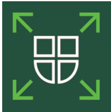
Logo Ortsplanungsrevision Köniz

Die Gemeinde Köniz wird zu einem wertvollen und für ihre Menschen attraktiven Lebensraum weiterentwickelt. Offenheit und Vernetzung im Inneren und gegen aussen sind ebenso wichtig wie die Pflege der einzelnen Quartiere und Orte. Die lokalen Nischen schaffen Identität. Die Planung orientiert sich an den Aspekten der Nachhaltigen Entwicklung. Diese Ziele skizzieren die räumliche Entwicklung der Gemeinde Köniz für die nächsten 20 Jahre. Die Richtplanung der Gemeinde Köniz ist seit dem 16. November in der Öffentlichen Mitwirkung.