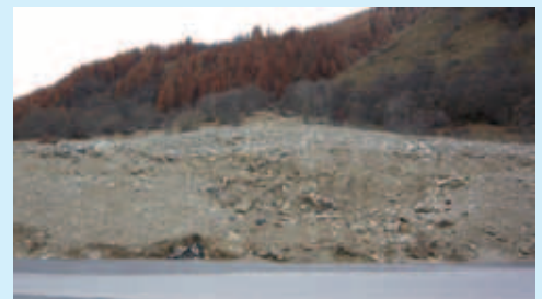
Landwirtschaftsland wurde stark verwüstet.