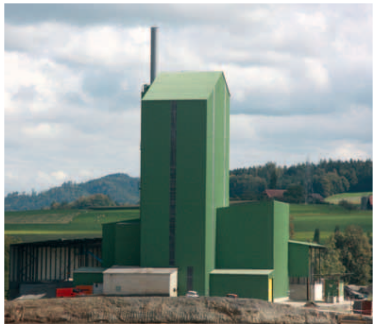
Das neue Belagswerk produziert innerhalb der Grenzwerte.