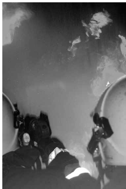
Mit der neuen Brandsimulationsanlage wird der Ernstfall geübt.