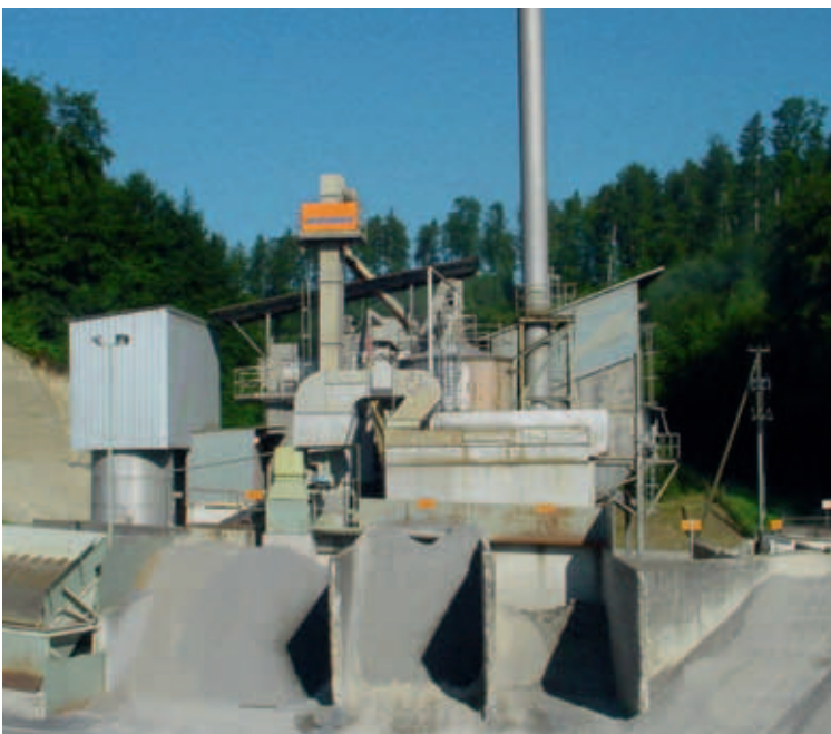
Das alte Belagswerk wurde 2008/09 abgebrochen.