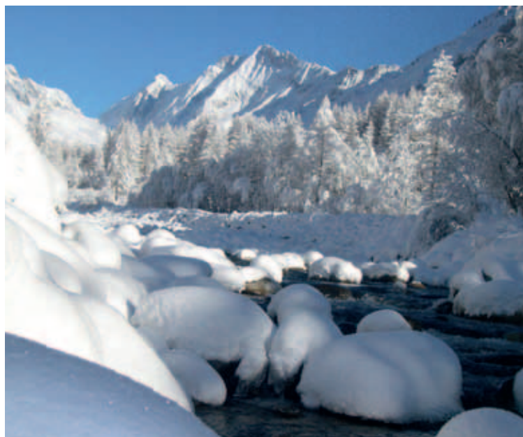
Den Winter im Lötschental geniessen: Köniz und Blatten lancieren zusammen mit Partnern ein Spezialangebot.