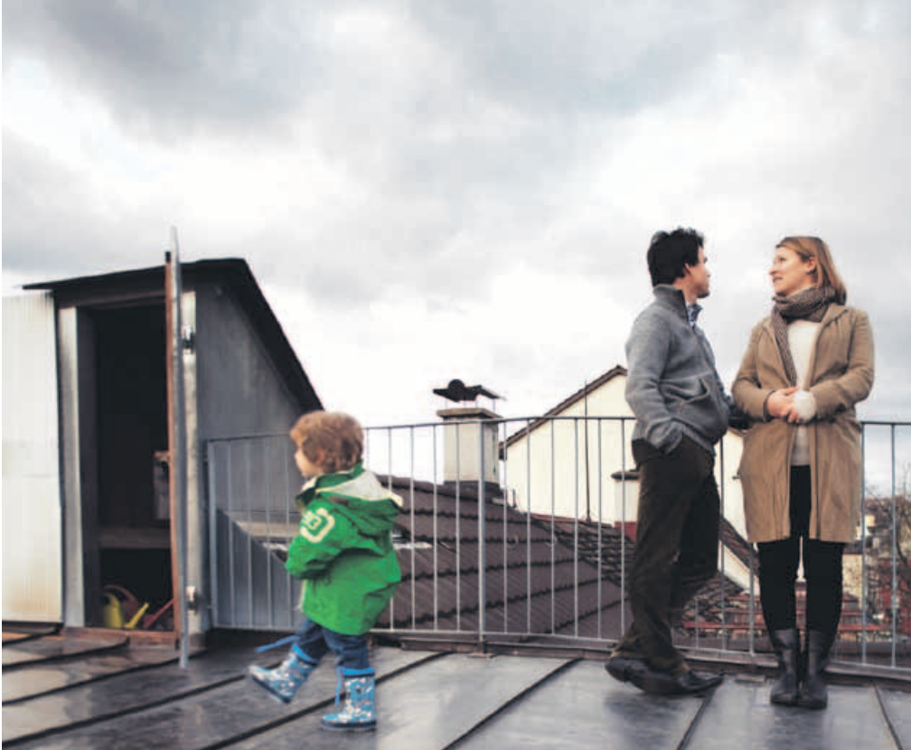
Die energieeffiziente Sanierung von Gebäudeteilen wird finanziell unterstützt.

Seit dem 1. Januar 2010 stellt der Kanton Bern wieder ein Förderprogramm für Energieeffizienz und erneuerbare Energien zur Verfügung. Im Topf befinden sich rund 15 Millionen Franken für diverse private Projekte.