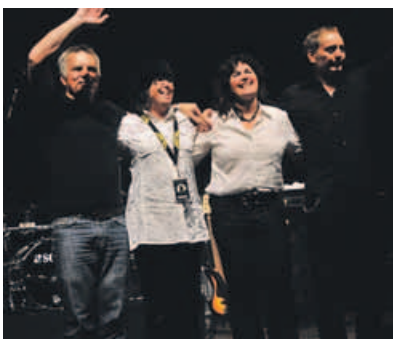
VanDango – Soul, Blues und R & B.