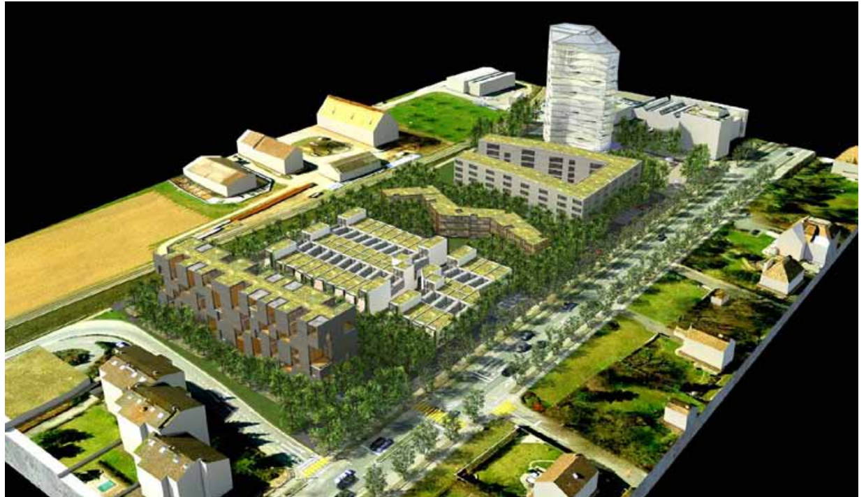
Wohnüberbauung auf dem Bächtelenacker in Wabern: Geplant ist attraktiver neuer Wohnraum für bis zu 600 Menschen.

Der Vorsteher der Direktion Präsidiales und Finanzen äussert sich zur Entwicklung des Könizer Ortsteils Wabern.