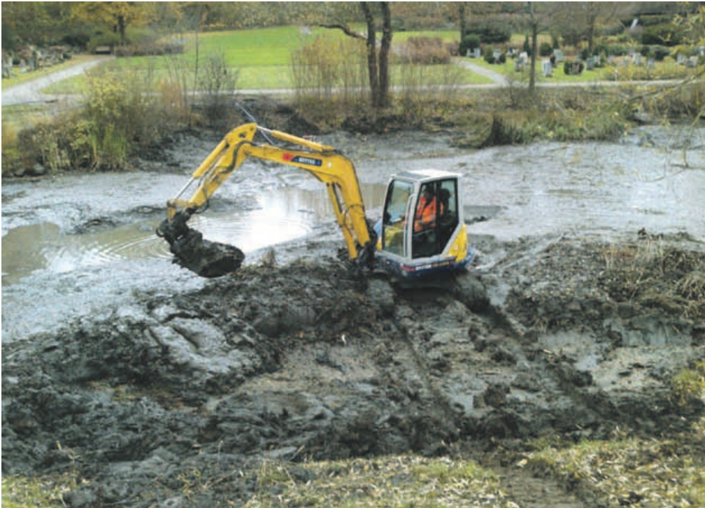
Mit einer Baumaschine wird der Schlamm aus dem Friedhofteich gebaggert.

Die Teich-Putzaktion im Friedhof von Köniz stiess auf unvorhergesehene Hindernisse: Kaum war das Wasser etwas abgelassen, standen die Arbeiter wortwörtlich vor einem Schlammassel.