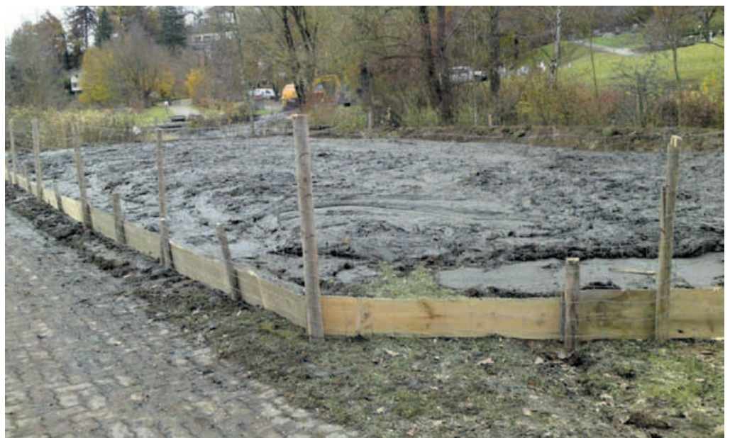
Der Schlamm wird neben dem Teich zwischengelagert.

Iris Hergarten Abteilung Umwelt und Landschaft