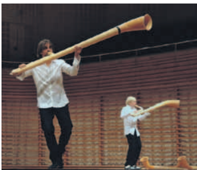
HORNROH – modernes Alphornquartett.