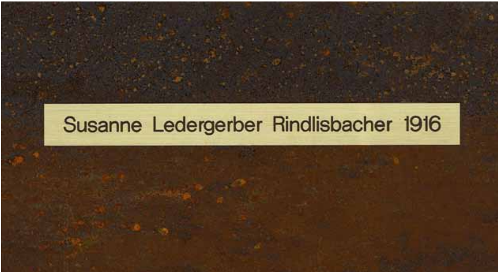
Namensschild für Gemeinschaftsgrab.

Im kommenden Frühling werden auf den Gemeinschaftsgräbern in Köniz, Wabern Nesslerenholz, Niederscherli und Oberwangen auf Wunsch Namensschilder der Verstorbenen angebracht. Die Angehörigen von seit dem Jahr 2000 verstorbenen Personen können die Plakette schriftlich bei der Friedhofsverwaltung bestellen.