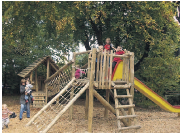
Spielplatz Hohle Gasse im Spiegel.

Ob in Wabern, Spiegel, Blinzern, Liebefeld, Gartenstadt, Niederwangen oder auf dem Gurten: In Köniz gibt es verteilt über das ganze Gemeindegebiet öffentlich zugängliche Kinderspielplätze. Die Webseite der Gemeinde Köniz bietet neu einen Überblick über die Standorte der Spielplätze, mit Angaben zum Inventar, Stand Erneuerung und Besitzer.