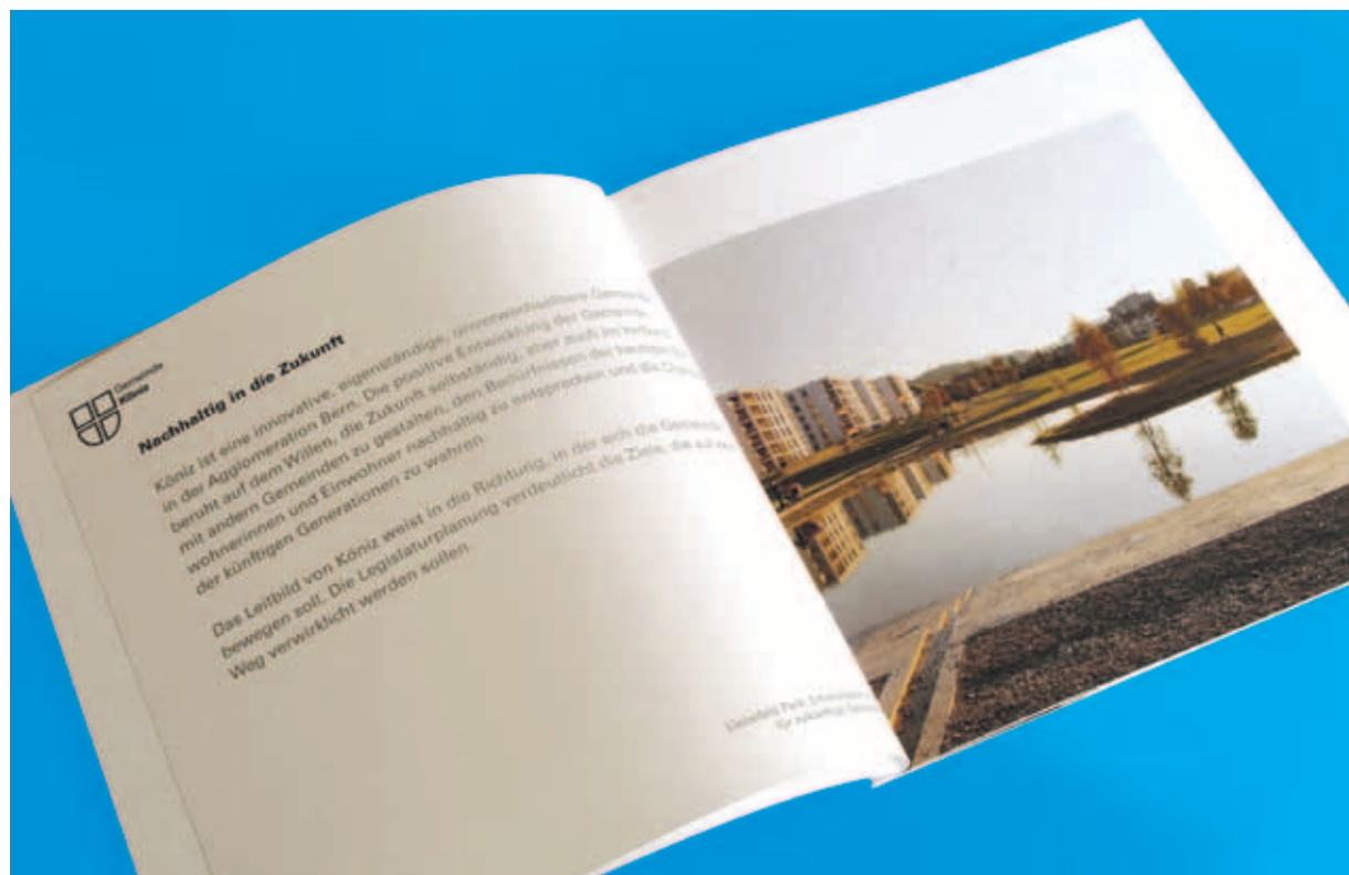
Das neue Leitbild liegt als gedruckte und mit Bildern illustrierte Broschüre vor.

Der Gemeindevorsteher äussert sich zum neuen Leitbild der Gemeinde Köniz.