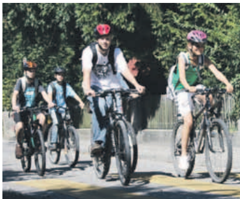
Mit dem Velo in die Schule – an der nationalen Kampagne können sich auch Könizer Schülerinnen und Schüler beteiligen.

Ziel ist es, während der Aktionsdauer von vier Wochen möglichst oft mit dem Velo zur Schule zu fahren und so Punkte zu sammeln. Dabei stärken die Kinder nicht nur auf spielerische Art Gesundheit und Wohlbefinden, sondern üben auch das Verhalten im Verkehr. Mit Begleitaktionen wie Veloflicktagen, Geschicklichkeitsfahren, Radwandertagen oder Helmaktionen kann das Punktetotal der Klassenteams aufgebessert werden. Die Begleitak-