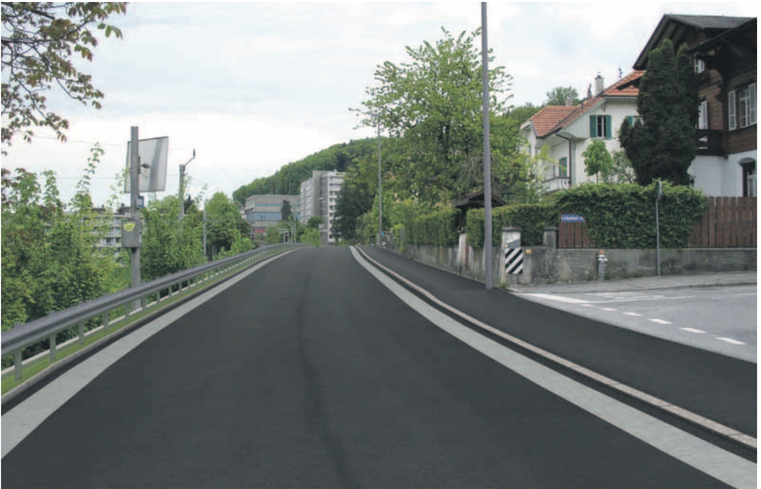
Fotomontage des Projektes Sanierung Kirchstrasse: Abschnitt Gurtenbühl mit dem neuen Trottoir auf der Quartierseite.