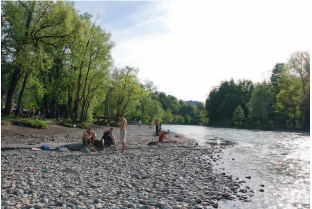
Die Aare im Eichholz: Die Natur und der Mensch brauchen das Wasser.

Die Vorsteherin der Direktion Umwelt und Betriebe äussert sich zur Nutzung und zum Schutz der Ressource Wasser.