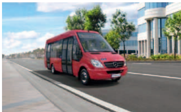
Ein Kleinbus dieses Typs erschliesst ab Dezember versuchsweise das Büschiacker-Quartier in den Farben von BERNMOBIL.

Detailinformationen mit dem genauen Fahrplan werden vom Linienbetreiber BERNMOBIL auf den Fahrplanwechsel kommuniziert. Es ist vorgesehen, die Linie mit einem kleinen Event am Samstag, 10. Dezember 2011, im Quartier Büschiacker bekannt zu machen.