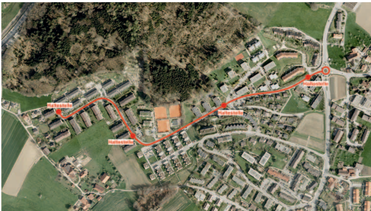
Linienführung und Haltestellenstandorte der neuen Linie Eichmatt (Kreisell rechts im Bild) bis Büschiacker (links im Bild), ab 12. Dezember 2011 in Betrieb.