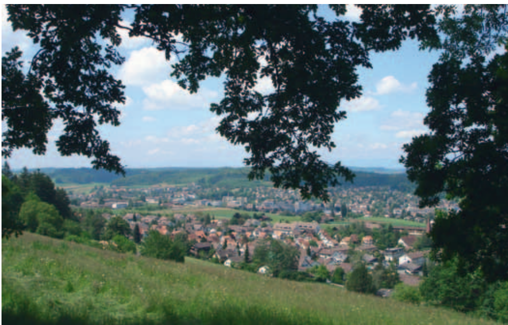
Köniz – die Gemeinde mit Aussichten.

Im aktuellen Städteranking der «Bilanz» erhielt Köniz von 136 bewerteten Schweizer Städten neu den 34. Platz. Damit verbessert Köniz seinen Platz um fast 40 Positionen gegenüber dem Vorjahr.