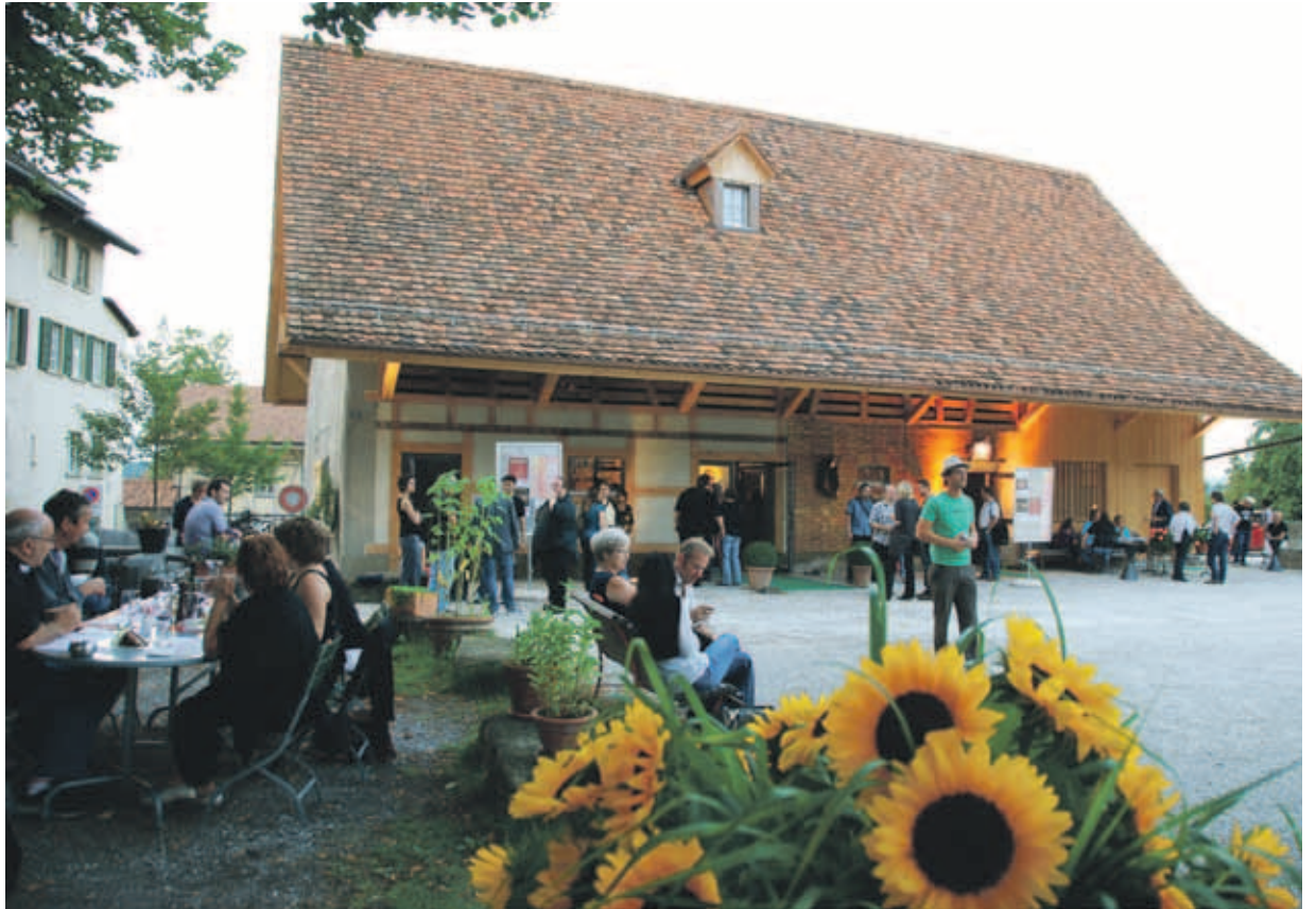
Lebendiges und vielfältiges Leben im Schloss Köniz.

Der Gemeindepäsident und Vorsteher der Direktion Präsidiales und Finanzen äussert sich zum Schlossareal Köniz.