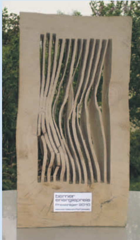
Der Energiepreis 2010 für Institutionen wurde nach Köniz vergeben.

Die Energiestadt Köniz ist stolz, dass ein diesjähriger Preisträger in ihrem Gemeindegebiet angesiedelt ist: Der Heimverein und die Pfadi Falkenstein Köniz wurden für ihre pädagogisch wertvollen und energetisch vorbildlichen Projekte verdientermassen prämiert. Kann sich nächstes Jahr wieder eine Könizer Institution auszeichnen?