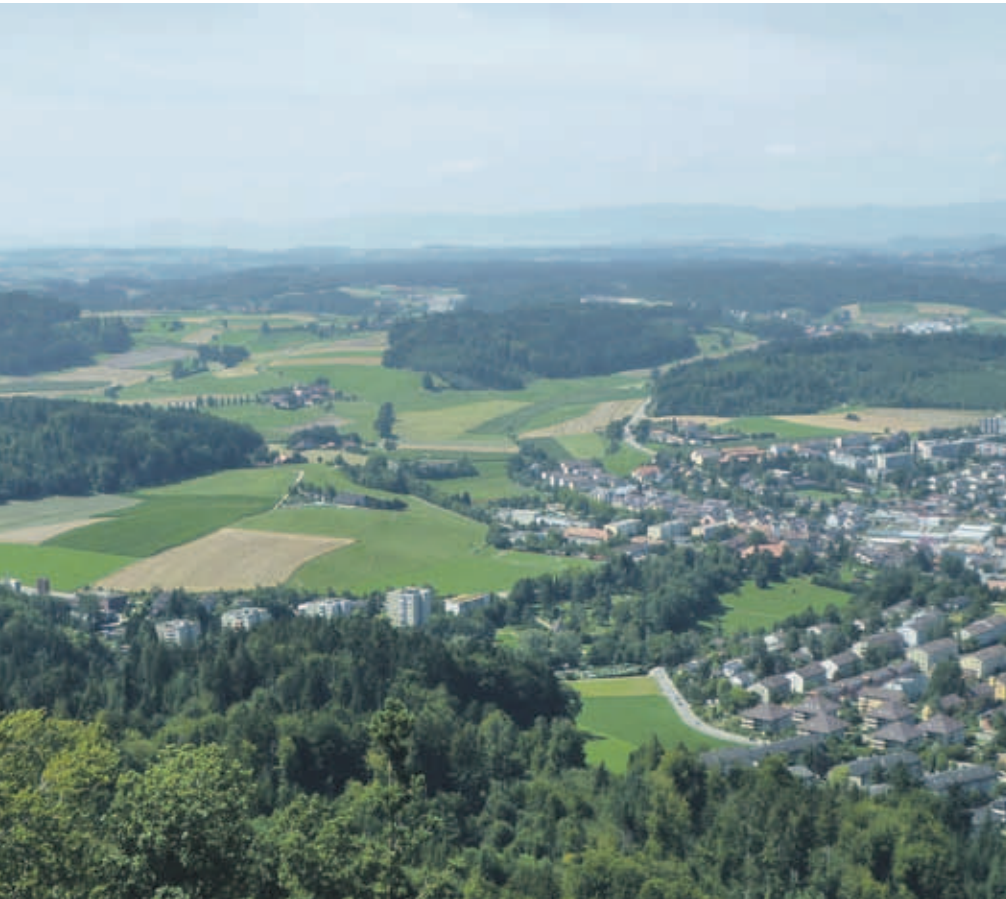
Die Entwicklung der Gemeinde Köniz wird durch die Ortsplanung wesentlich geprägt.

Im Juli vergangenen Jahres startete die Revision der Ortsplanung der Gemeinde Köniz. Viele Ideen, Visionen und Konzepte wurden entwickelt und diskutiert, vertieft oder wieder verworfen. Entstanden ist daraus ein Gesamtwerk für die räumliche Entwicklung der Gemeinde Köniz für die nächsten 20 Jahre. Ab dem 16. November wird die Richtplanung zur Öffentlichen Mitwirkung gebracht.