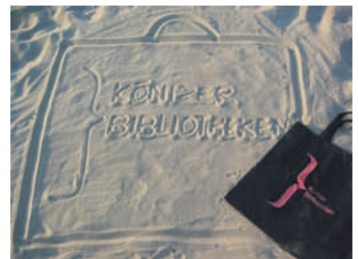
3. Platz: Roger Künzli, Liebefeld