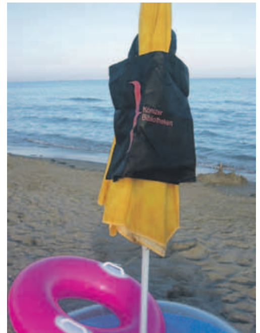
2. Platz: Sven Künzli, Liebefeld

Die preisgekrönten und alle anderen Fotos werden in der Bibliothek Stapfen ausgestellt.