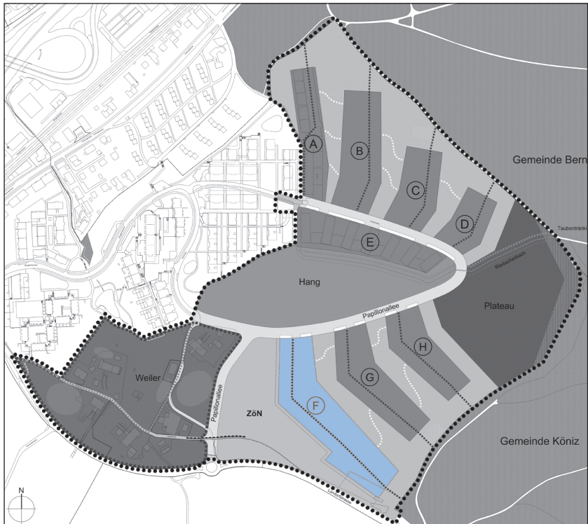
Plan und Modell Wohnüberbauung Papillon mit Baufeld F.