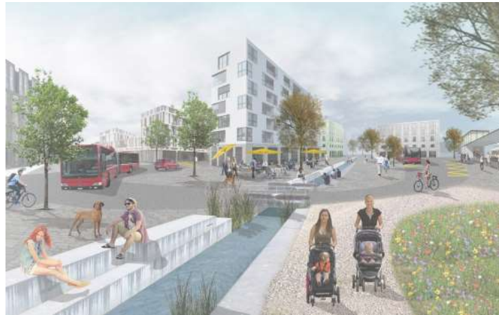
Abb. 4: Visualisierung Richtprojekt