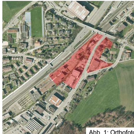
Abb. 1: Orthofoto