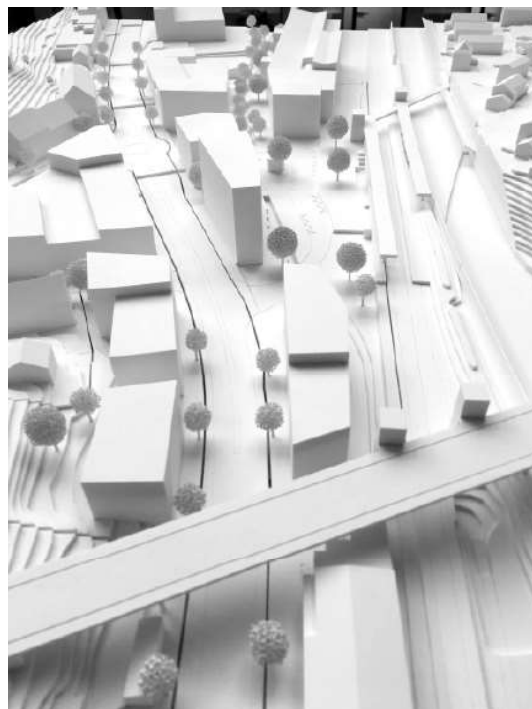
Abb. 3: Modellfoto