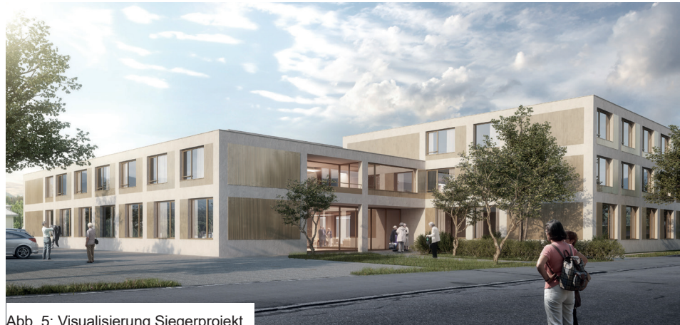
Abb. 5: Visualisierung Siegerprojekt