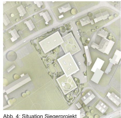
Abb. 4: Situation Siegerprojekt