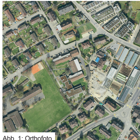
Abb. 1: Orthofoto