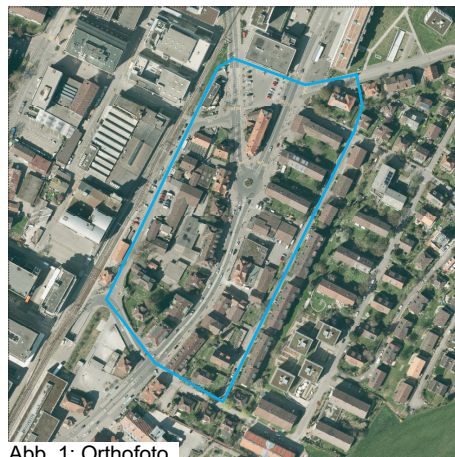
Abb. 1: Orthofoto