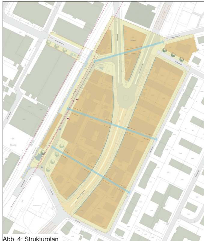
Abb. 4: Strukturplan