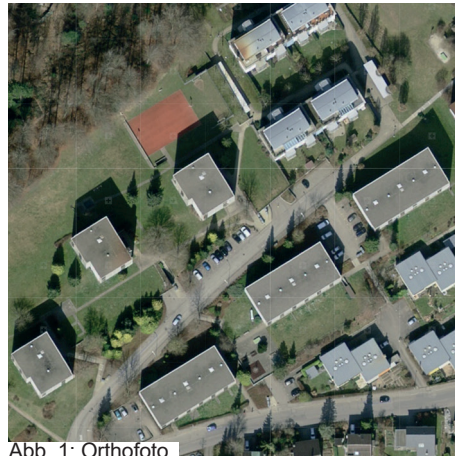
Abb. 1: Orthofoto