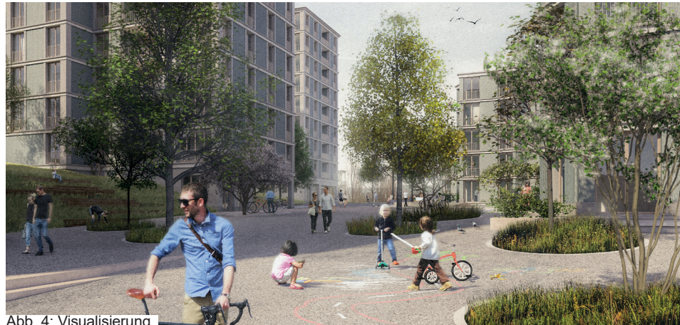
Abb. 4: Visualisierung