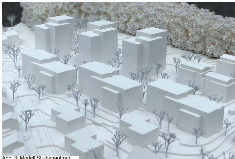
Abb. 3: Modell Studienauftrag

Oktober 2018 bis Mai 2019 12. Februar bis 13. März 2020 24. Februar bis 27. März 2023 3. Quartal 2024