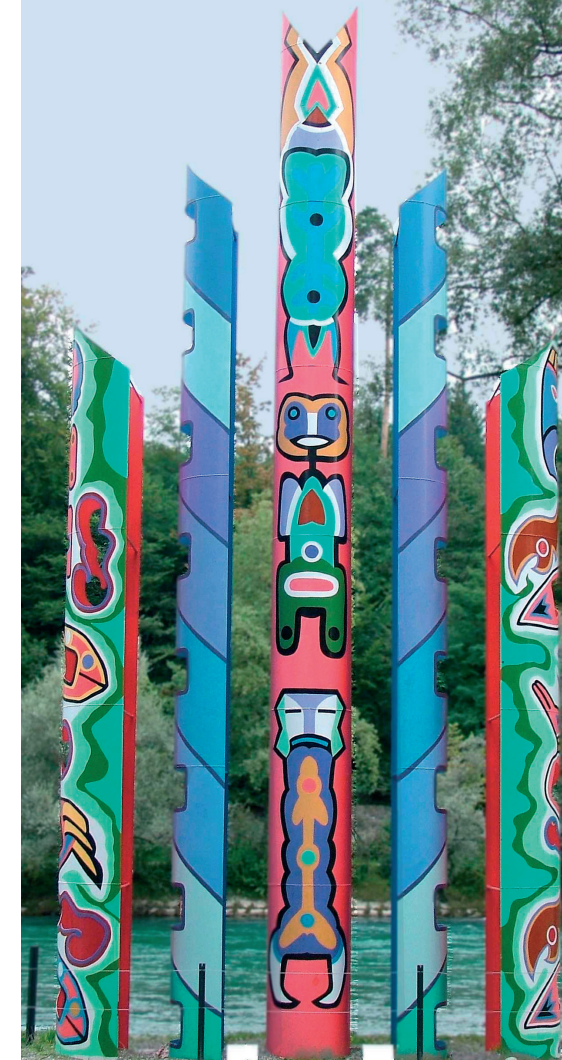
(Skulptur «The Guardian» von Margret Hugli-Lewis)