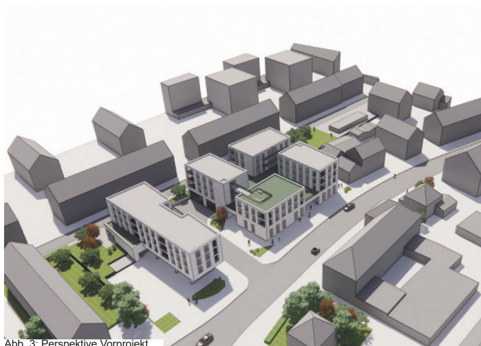
Abb. 3: Perspektive Vorprojekt