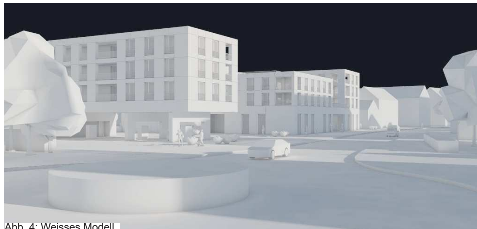
Abb. 4: Weisses Modell