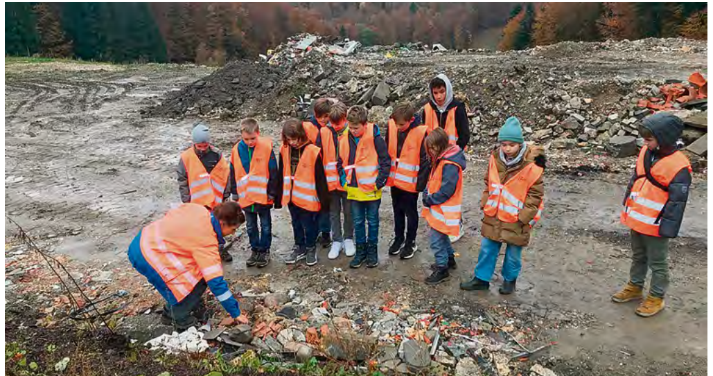
Die Kehrichtdeponie Gummersloch (KEGUL) in Köniz wurde vor 20 Jahren geschlossen. Danach wurde der Müll mit ungiftigem Bauschutt zugedeckt.

Zurück zum Thema. Was Recycling ist, dürfte nun klar sein. Aber es gibt auch Müll, den man nicht recyceln kann, der wird verbrannt, zum Beispiel Sofas und Betten, Regale und andere Möbelstücke. Die Verbrennung nutzen wir, um Energie zu gewinnen. Auch der Müll, den Sie aus dem Alltag kennen, also die Ghüdersäcke, wird verbrannt. Das, was man weder recyceln noch verbrennen kann, wird auf einer Deponie deponiert, zum Beispiel Blumentöpfe, Spiegel, Vasen und Bauschutt. Auf der Deponie dürfen heute nur Stoffe gelagert werden, die nicht mehr reagieren