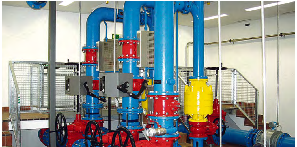
Auch in den Bereichen Trinkwasserversorgung und Siedlungsentwässerung gelten aktuell Restriktionen.