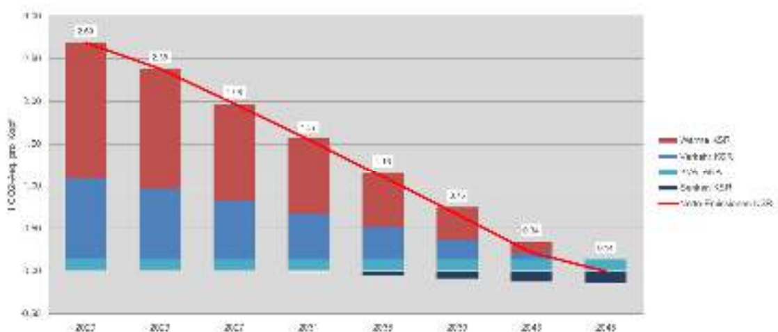
Abbildung 2: Der Absenkpfad gemäss Art. 2 Abs. 1. In den Kästchen: Brutto-Emissionen.

HINWEIS: DIE ZAHLEN DER KANTONALEN KLIMAMETRIK (SIEHE EXKURS BEI ART. 6) LIEGEN NOCH NICHT VOR. DIE TONNAGEN SIND DESHALB NOCH PROVISORISCH. DIE KLIMAGASBILANZ NACH DER KANTONALEN KLIMAMETRIK KANN ZU LEICHTEN ÄNDERUNGEN FÜHREN.