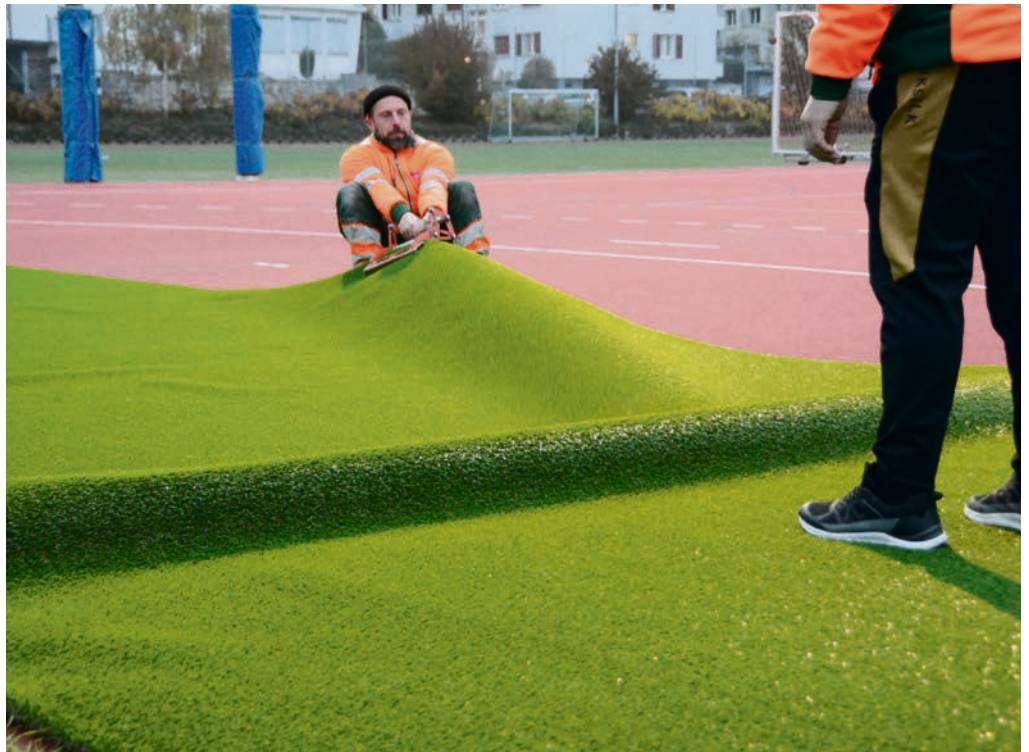
Die Rumpfe müssen raus. Bei Kälte sind die Kunstrasenbahnen steif.

Mitte Oktober wurde ein Kunstrasenfeld in Niederscherli auf dem Hartplatz bei der Schule Bodengässli von einer externen Firma ausgerollt. Das freut insbesondere das Frauenteam Schwarzwasser, das nun regelmässiger im Winter trainieren kann. Im November wird in Wabern bei der Schule Lerbermatt die Hälfte des Hartplatzes mit einem Allwetter-Kunstrasenfeld bedeckt. Die Rasenfelder bleiben von November bis Mitte März liegen.