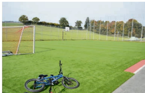
Am Tag darauf lässt es sich schon Spielen.