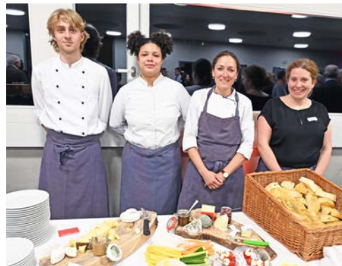
Brachte Gaumenfreude: Das engagierte Catering-Team der Stiftung Bächtelen aus Wabern.