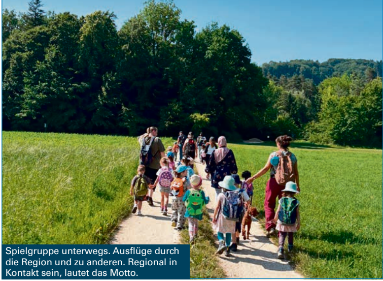
Spielgruppe unterwegs. Ausflüge durch die Region und zu anderen. Regional in Kontakt sein, lautet das Motto.