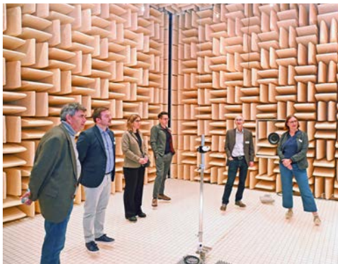
Einmal leiser treten: Im echofreien Raum erleben die Gäste phänomenale Stille.