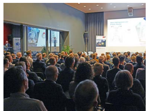
Breites Interesse: Am Könizer Wirtschaftsapéro beginnen auch Bekanntschaften.