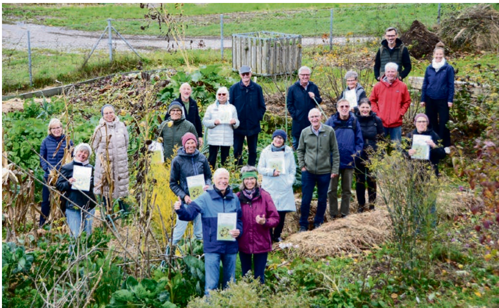
Sie zeigen, dass man für die Natur auch im Kleinen wirksam sein kann: Diese Freizeit-Gärtnerinnen erhalten für ihre naturnahen Gärten das Label «Biodiversitätsgarten».

Köniz hat heuer zum ersten Mal eine Auszeichnung von naturnahen Privatgärten mit dem Label «Biodiversitätsgarten» organisiert. Dafür wurden in Wabern zahlreiche Freizeitgärtner von Expertinnen für Biodiversität besucht und beraten. Im Oktober war die Zertifikatsübergabe.