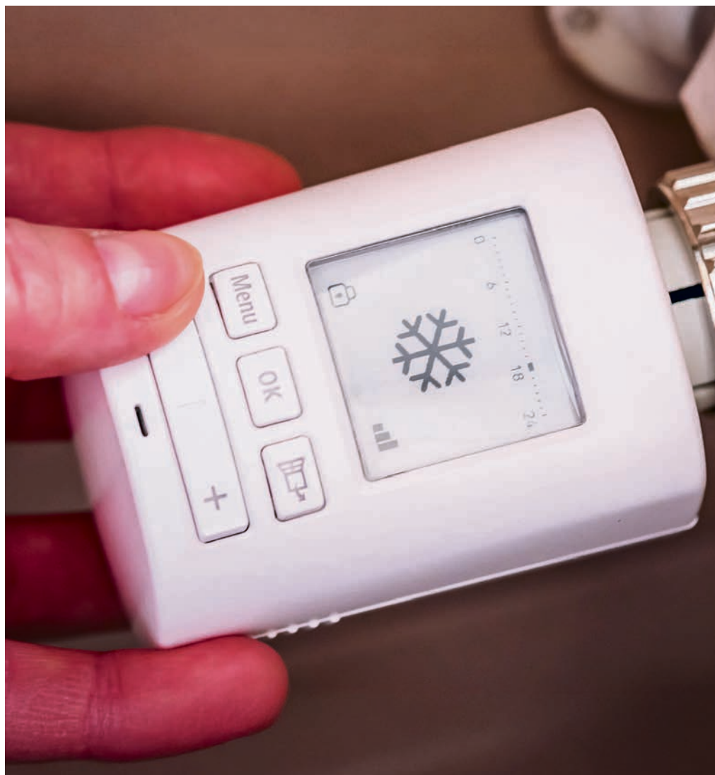
Mit einem Thermostat können Sie die Temperatur regulieren und Energie sparen.

Statt die Fenster lange Zeit gekippt zu lassen, sollten Sie Stosslüften. Öffnen Sie die Fenster für kurze Zeit vollständig und in allen Räumen, um die Luft auszutauschen. Gekippte Fenster sorgen kaum für Luftaustausch, sie kühlen nur die Wände aus.