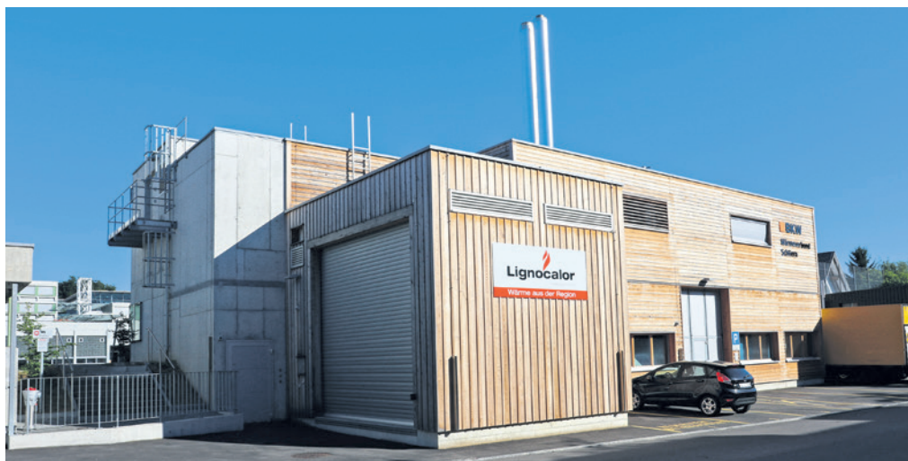
Heizentrale in Schliern. Wärmeverbünde sind zentral für das Senken der CO 2 -Emissionen im Gebäudebereich.

Betrachtet werden in der aktuellen Klimagasbilanz die Bereiche (Sektoren)