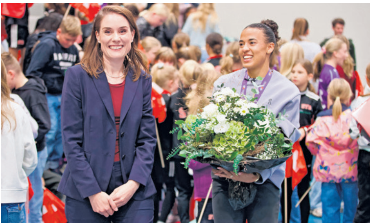
Der Freude ein Gesicht geben: Tanja Bauer bei der Ehrung der Könizer Weltmeisterin Ditaji Kambundji mit vielen begeisterten Kindern.

Ein Wermutstropfen bleibt in diesem Rück- und Ausblick: Der Bau des neuen Schulhauses Morillon konnte aufgrund von Einsparungen noch nicht starten und muss auf die nächste Legislatur verschoben werden. Auch hier bleiben wir am Ball.