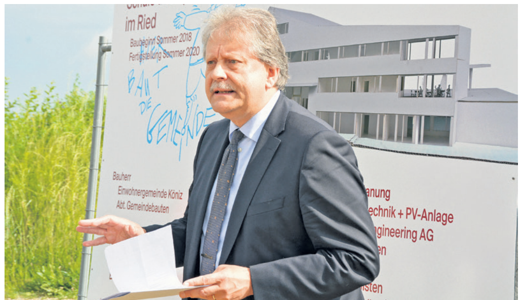
Der Baustart einer Schule ist ein Meilenstein, die Einweihung später die Krönung. Baustart der Schul- und Sportanlage im Ried in Niederwangen 2018. Die Schule wurde 2020 eingeweiht.

Für mich waren verschiedenste Projekte und Aufgaben sehr bedeutsam, ob es nun um die konkrete Umsetzung des Alterskonzepts, Betreuungsgutscheine, die neue Ordnung der Schul-