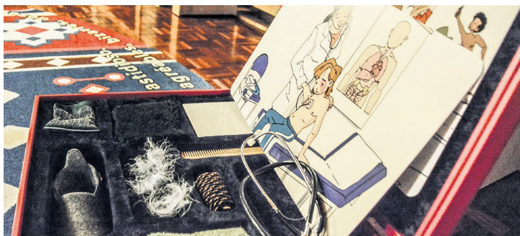
Gespür für Situationen entwickeln: Was fühlt sich gut an? Was ist notwendig? Das kalte Stethoskop bei der Ärztin oder beim Arzt ist zwar unangenehm, aber es gehört eindeutig zur Untersuchung.

Akute Fälle: Lantana, Fachstelle Opferhilfe bei sexualisierter Gewalt in Bern info@lantana-bern.ch / 031 313 14 00