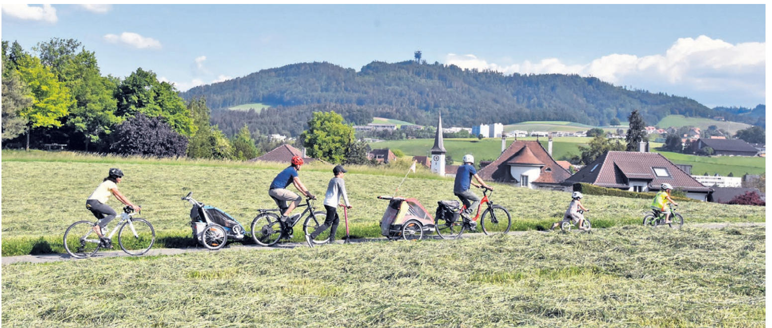
Lebensqualität fördern: Mit Spass und Sicherheit Velo fahren in Köniz.

Respekt und Verständnis sind keine Selbstverständlichkeit. Sie entstehen dort, wo Menschen einander mit Aufmerksamkeit, Rücksicht und Verantwortung begegnen. Dafür danke ich Ihnen – und setze mich weiterhin mit Überzeugung für diese Werte ein.