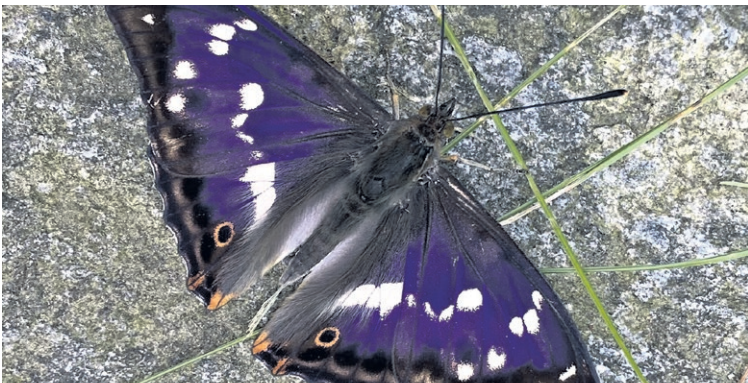
Der grosse Schillerfalter wurde letztes Jahr bei der reformierten Kirche in Wabern gesichtet. An Blüten ist er selten zu sehen. Häufig ruht er auf Eichen. Die Raupen mögen die Blätter der Salweide besonders.