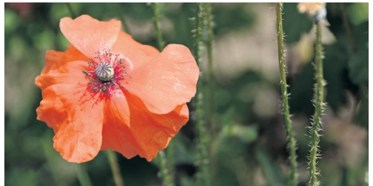
Klatschmohn ist eine einjährige Wildpflanze und eine wertvolle Nahrungsquelle für Bienen, Hummeln und Schwebfliegen. Ideal fürs ökologische Aufwerten von Wildblumenwiesen und Brachflächen.

Zum zweiten Mal organisiert die Gemeinde Köniz eine Auszeichnung von naturnahen Privatgärten mit dem Label «BiodiversitätsGarten». Naturgartenspezialisten besuchen Gärten im ganzen Gemeindegebiet. Eine rasche Anmeldung lohnt sich.