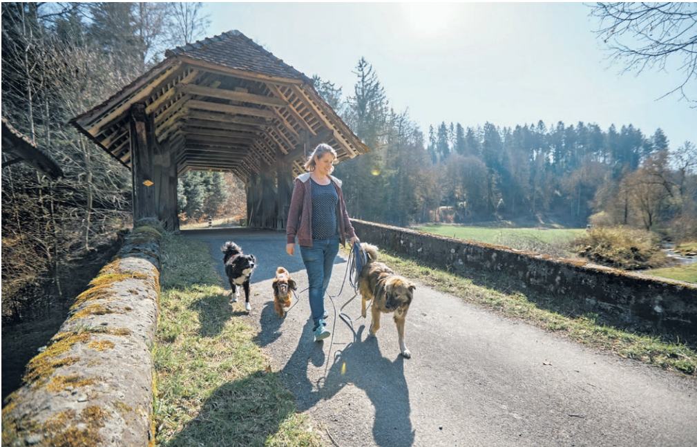
An einer Schleppele kann der Hund freier gehen und die Halterin behält die Kontrolle.

zu sehen. Dackelrüde Tabi trägt in manchen Situationen auch einen Maulkorb. Warum? «Es ist nicht sicher, ob er aus Angst mal schnappt. Dann braucht ein Hund einen Maulkorb.»