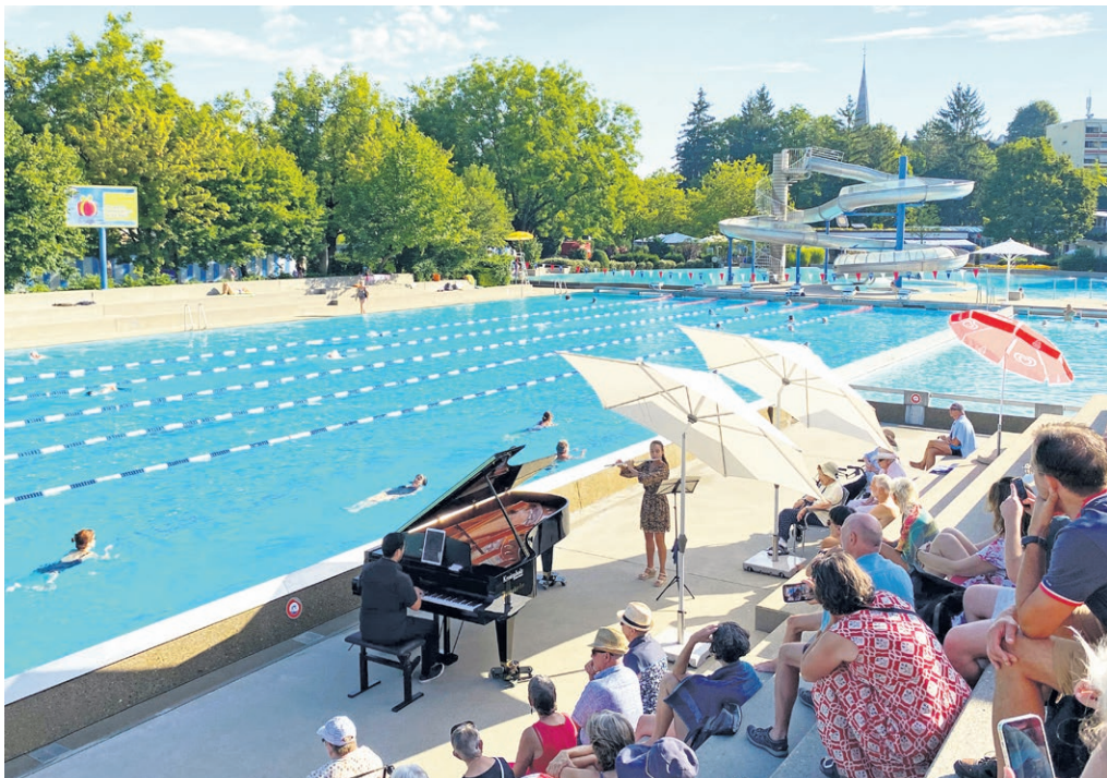
Der Konzertflügel in der Badi: Das Musikformat Klavier am Becken.

Die Badisaison im Schwimmbad Weiermatt startet heuer am Samstag, 9. Mai. Vorfreude: Nutzen Sie den Vorverkauf für Ihr Bade-Abo. Ende Juni bringt das Badi-Team den Sommer mit dem Wochenende «Musikkultur trifft Badekultur» zum Klingen.