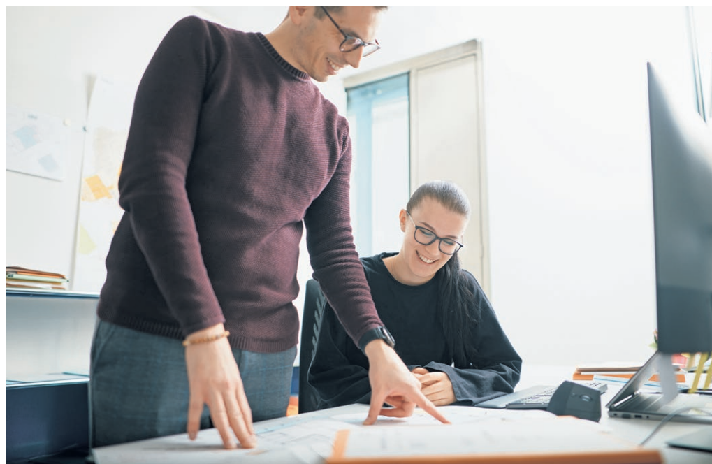
Voneinander lernen dank vielseitigen Qualifikationen: Eine Junior-Verfahrensleitung kann im Bauinspektorat Köniz viel lernen. Aber das Team auch von ihr.

Sarah Leonor Müller Fachverantwortliche Kommunikation