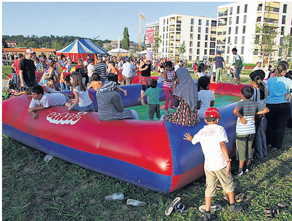
Der Liebefeld Leist organisiert im Liebefeld Park verschiedene Veranstaltungen, z. B. das Liebefeld Open (Bild). Dieses Jahr findet es übrigens am Samstag, 2. Mai 2026, statt.

Wimmelbild Badi: Die Könizer Badisaison beginnt am 9. Mai. Die «strengen» Bademeister:innen, die hier täglich im Gewimmel für Sicherheit bei Becken und Sprungturm sorgen, pflegen einen besonderen Ausgleich: Die Musik. Auch dieses Jahr können Sie während des Längenziehens der Klaviermusik lauschen oder ihre Kinder für Ihre Ruhe in die Kinderdisco schicken. Nun wünsche ich Ihnen einen schönen Start in die sonnigen Tage – mit vielen neuen Begegnungen, die unsere Gemeinde lebendig machen.