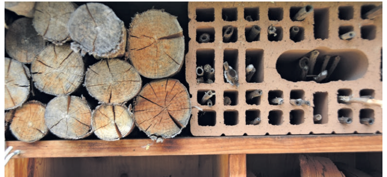
Bitte Gastfreundschaft für Insekten: Insekten, darunter v.a. Wildbienen, bereichern die Flora im Garten.