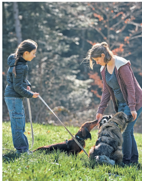
Belohnen hilft, dass der Hund sich auch Dinge merkt. Er hat dadurch Spass.

WhatsApp-Kanal gibt sie Einblick. Personen, die sich einen Hund zulegen wollen, rät sie, sich folgende Fragen zu stellen: Was will ich mit dem Hund? Was muss er können? Wie regle ich die Betreuung? Sich zu informieren und zu interessieren, sei das A und O. Der Hund sei ein faszinierendes und grossartiges Tier. «Wenn die Motivation da ist, kann man mit einem Hund wirklich alles erreichen.»