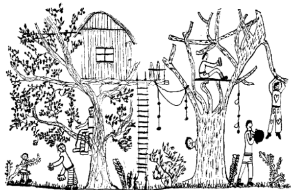
Dieser Wunschgarten eines Kindes ermöglicht: klettern, sich verstecken, hängen, schwingen, auf einem Ast träumen...

Die Kinder sollen sich angeregt und herausgefordert fühlen durch die Topographie, die Bepflanzung, durch helle und schattige Bereiche, weiche und harte Materialien, durch Sand, Erde und fließendes Wasser, durch die Möglichkeit zum Feuermachen, durch Farben und Formen sowie durch verschiedene Spielgeräte und Nutzungsbereiche. Die Spielgeräte dominieren den Spielplatz nicht.