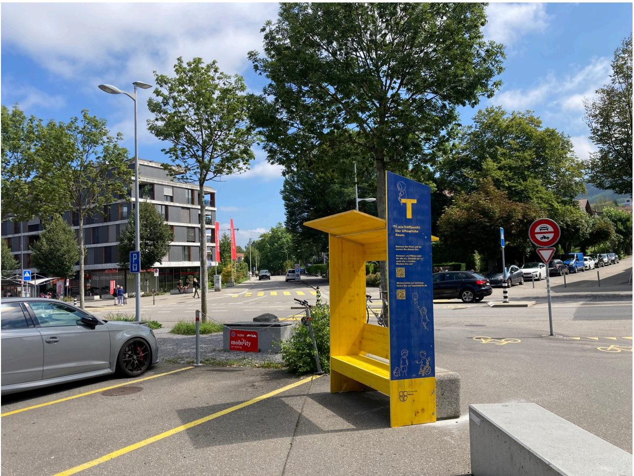
Projekt «T wie Träffpunkt - Der öffentliche Raum»