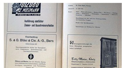
Festprogramm "1000-Jahr-Feier-Köniz", 1949