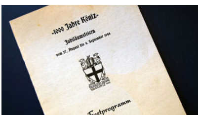
Festprogramm "1000-Jahr-Feier-Köniz", 1949