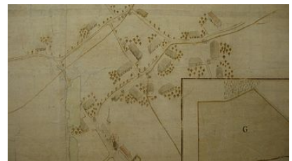
Plan Stettlergut, 1728, restauriert 2008