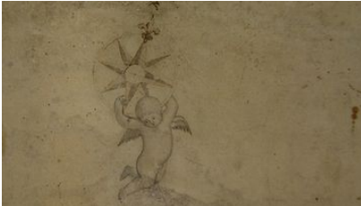
Plan Stettlergut, 1728, restauriert 2008