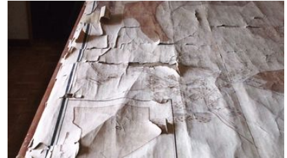
Plan Stettlergut, 1728, vor der Restauration 2008