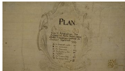
Plan Stettlergut, 1728, restauriert 2008