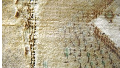
Plan Stettlergut, 1728, vor der Restauration 2008