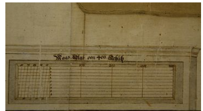
Plan Stettlergut, 1728, restauriert 2008