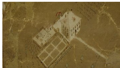
Plan Stettlergut, 1728, restauriert 2008