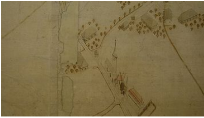
Plan Stettlergut, 1728, restauriert 2008