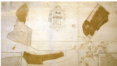
Plan Stettlergut, 1728, restauriert 2008