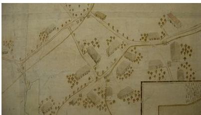
Plan Stettlergut, 1728, restauriert 2008