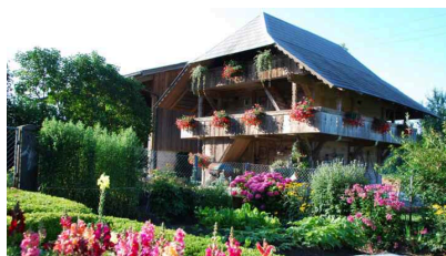
Spycher in Liebewil