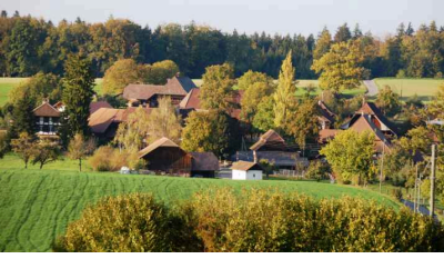
Blick auf Herzwil