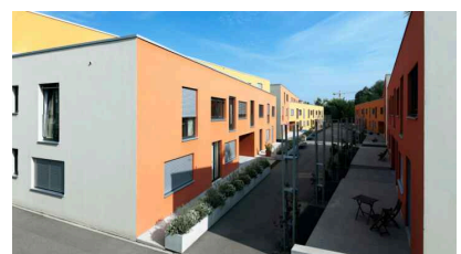
Wohnsiedlung Neumatt-Weissenstein an der Grenze zur