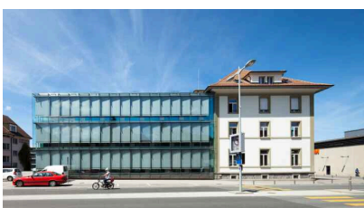
Gemeindehaus mit Anbau